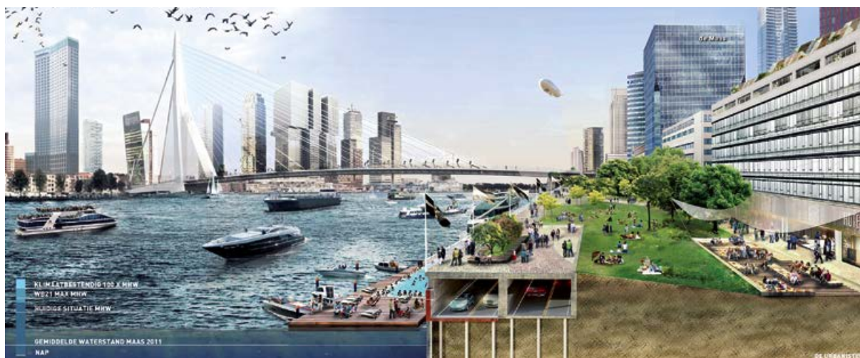
Exemple de digue multifonctionnelle qui permet un développement urbain (projet à Rotterdam). Projet Boompljes City balcony à Rotterdam (Pays-Bas).

Concevoir un bâtiment ayant plusieurs usages, peut permettre de rentabiliser sa construction à moyen, voire long terme. Par contre à court terme, les coûts liés à l'adaptation de l'infrastructure à l'inondation peuvent être importants, et représenter un surcoût par rapport à une infrastructure non adaptée. Par ailleurs, certaines questions demeurent en suspens : est-il possible de construire des bâtiments multifonctionnels partout, au regard des documents d'urbanisme notamment ? Comment entretenir dans la durée les différentes fonctions d'une telle infrastructure ? Qui en assure l'entretien et la gestion ?